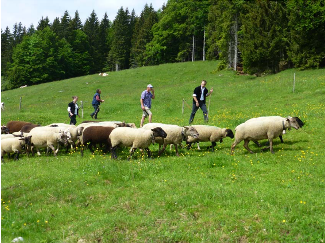
Le troupeau a pris au droit...